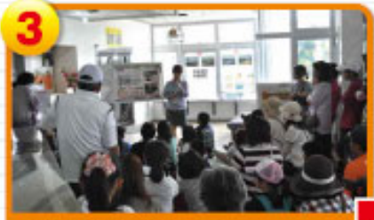
3 倉敷ダム (倉敷ダム事務所) 黒水や印川を貯水するしくみなどを、物知り頂きました。