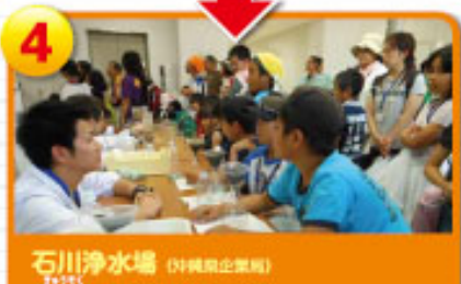
4 石川浄水場 (沖縄県企業団) 「全道ろ過」と呼ばれる浄水施設で天候に影響されない屋内施設となっており、見学当日は、水をきれいにする実験も体験できました。

参加していた親子は、みなさん真剣な表情で施設説明を聞いていました。「親子で参加出来て良かった。」「水道水を作るまでを勉強して夏休みの自由研究にしたい！」などの感想が聞かれ、水道水について楽しみながら学んでいました。