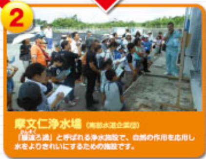
2 摩文仁浄水場 (南部水道企業団) 「自然ろ過」と呼ばれる浄水施設で、自然の作用を応用し水をよりきれいにするための施設です。